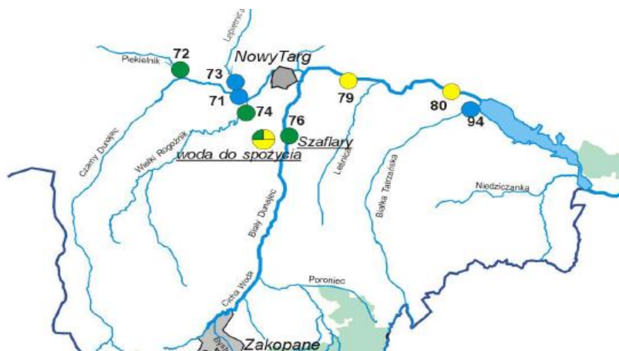
Siec hydrograficzna Nowej Białej

Na południe od Łopusznej i Ostrowska po Nową Białą znajdują się duże zasoby glin, dotychczas prawie nie eksploatowane. Ich łączne zasoby szacowane są na około 80 mln m 3 . Z wielu glin można uzyskać pełny asortyment produktów budowlanych.