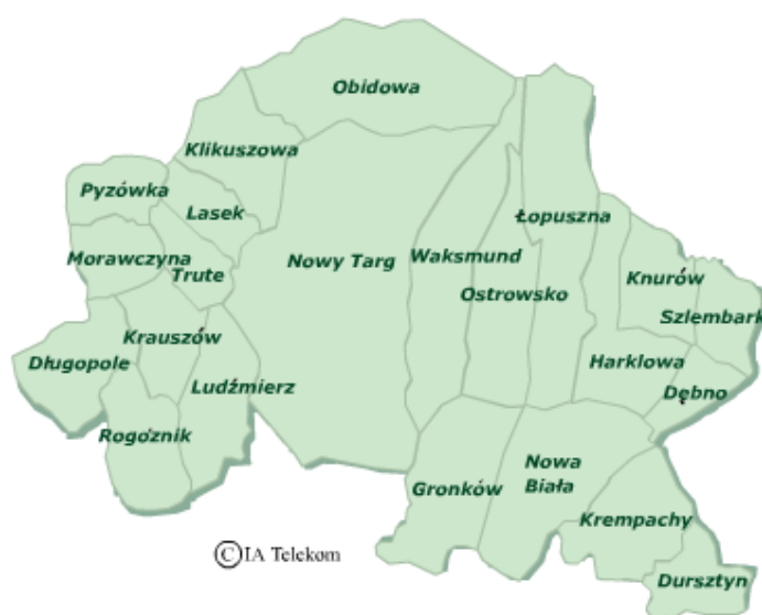
Położenie Nowej Białej na tle Gminy Nowy Targ

Gronia i Gronkowa. Na południe od Nowej Białej, między wapiennymi skałkami: Oblazowej i Kramnicy, przeciska się tatrzańska rzeka Białka tworząc malowniczy przełom. Jest to niezwykle urokliwy zakątek pod względem przyrodniczym, będący pod ochroną jako rezerwat przyrody.